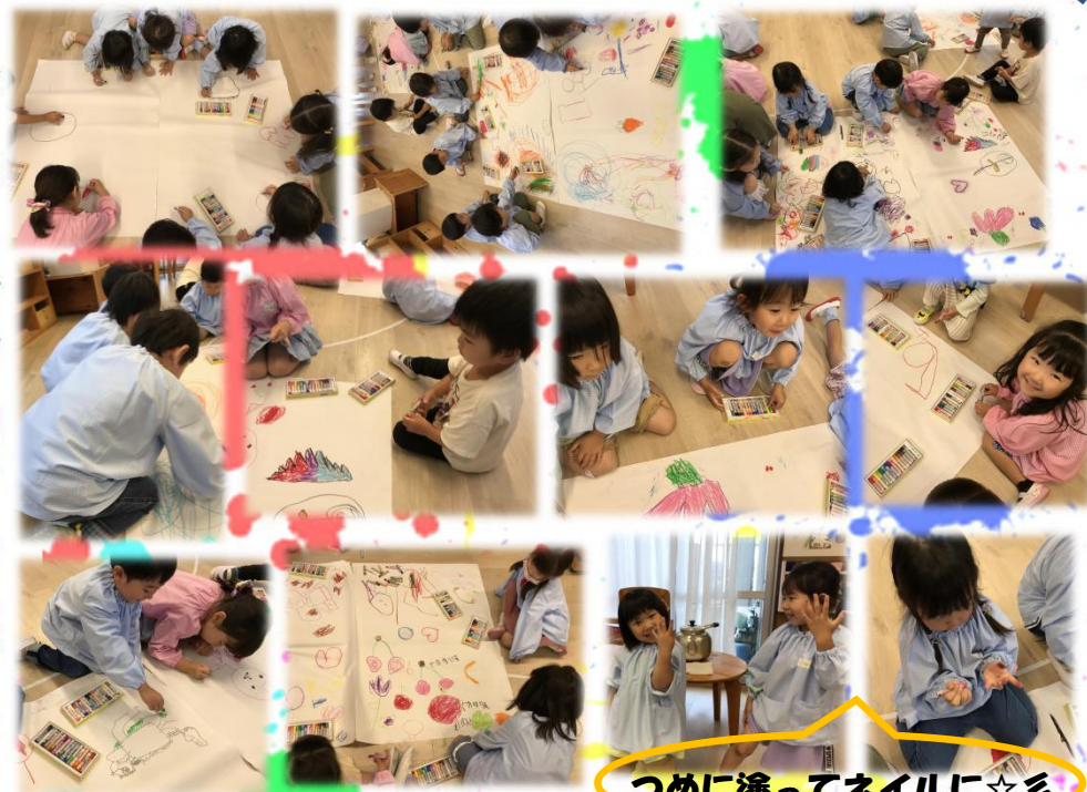
つめに塗ってネイルに☆

5月に全体活動で取り組んだクレパスを使って遊びました。5月とは違い大きな模造紙にお友達と一緒に行いました。いつもと違い、床に模造紙を敷いて描いたことで、描いていくうちにダイナミックな絵が完成していきました。その後も、自由活動の時に模造紙を用意し、自由に描くことを楽しみました。全体活動の時には「みんなの前で描くのが恥ずかしい」と言っていた子どもも自由遊びの時間にクレパスに触れる姿があり、クラス全体でクレパスにより興味を持つことが出来たと感じています！